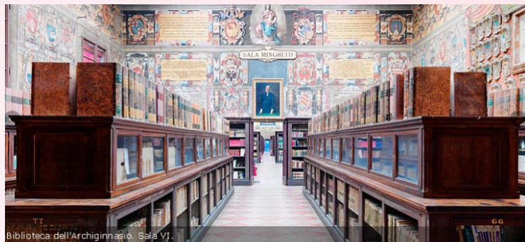
Biblioteca dell'Archiginnasio, Sala VI