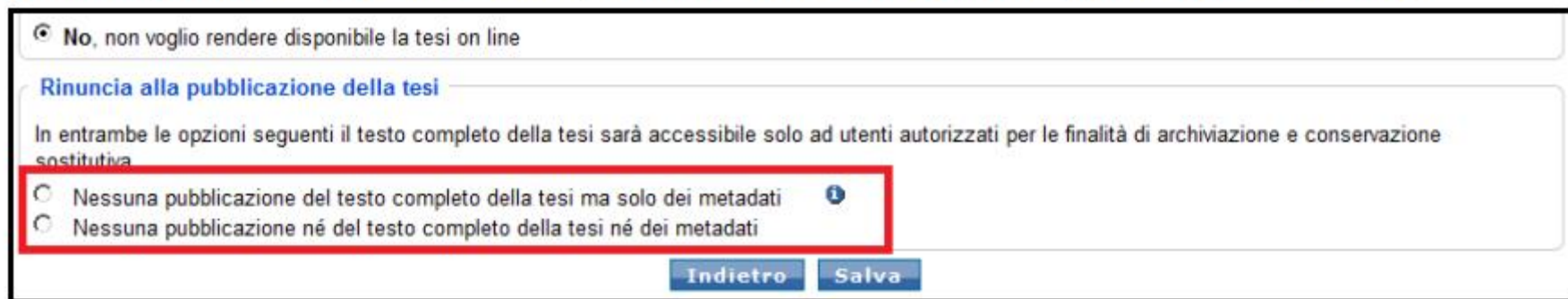
Figura 26 – Rinuncia alla pubblicazione della tesi

Dopo aver selezionato l'opzione di non rendere pubblica la tesi, potrai scegliere se pubblicare o no i metadati (dati descrittivi della tesi comprensivi di autore, titolo, relatore, parole chiave, abstract):