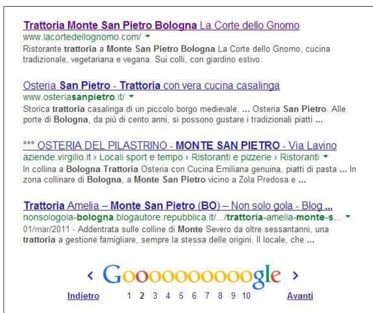
Figura 6 Seconda pagina di Google il 27 ottobre

Per rispondere alla domanda quindi, stando a quanto accaduto nei casi di Blescia Bus e della Trattoria La Corte dello Gnomo, ritengo che l'utilizzo costante dei social media possa essere un'alternativa all'investimenti economico su Google AdWords, infatti nel primo caso l'utilizzo di Google+ e Facebook si è rivelato essere più utile, a livello di visualizzazione sul motore di ricerca, rispetto all'utilizzo di Google AdWords, nel secondo caso gli stessi due social media hanno fatto sì che il sito internet scalasse, in un primo momento, fino alla pagina quinta del motore di ricerca Google, e in un secondo momento fino alla seconda 7 .