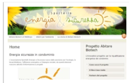
Figura 3 sito web del secondo caso