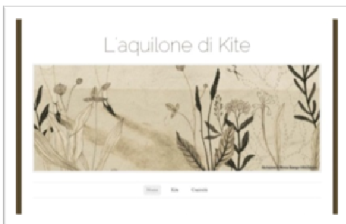
Figura 4 sito web del terzo caso