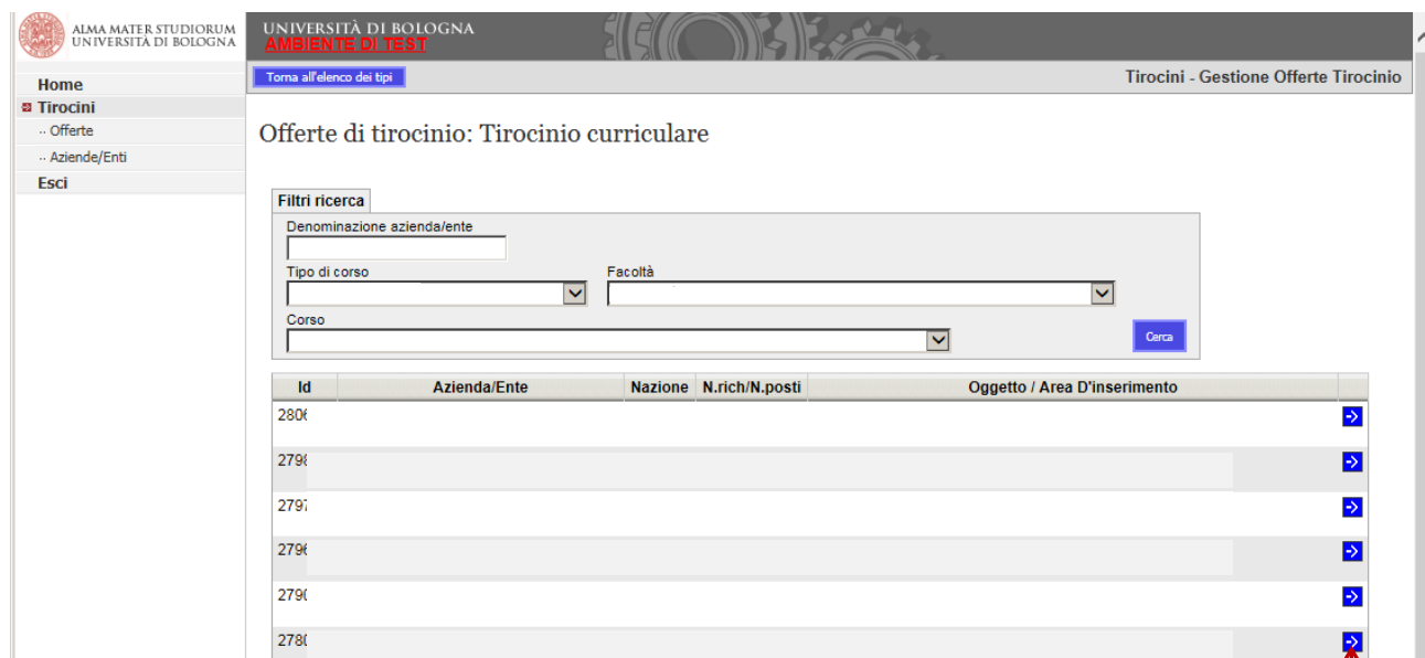
Fig. 3 – Offerte di Tirocinio: Tirocinio curriculare

Cliccare la freccia blu per visualizzare i dettagli delle offerte